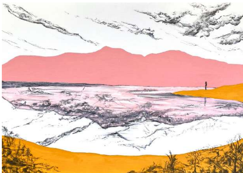
Adélaïde de Saint-Marc, Rose Montagne, 2026, fusain et acrylique sur toile, 65x92cm