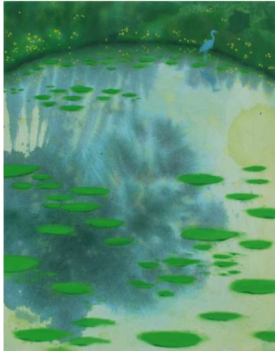
Léa Le Floc'h, Le héron de Family, 2025, acrylique et huile sur toile, 70x55cm