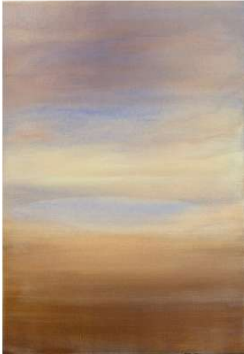
Denis Christophel, Harmonie du soir, 2026, huile sur toile, 90x73cm